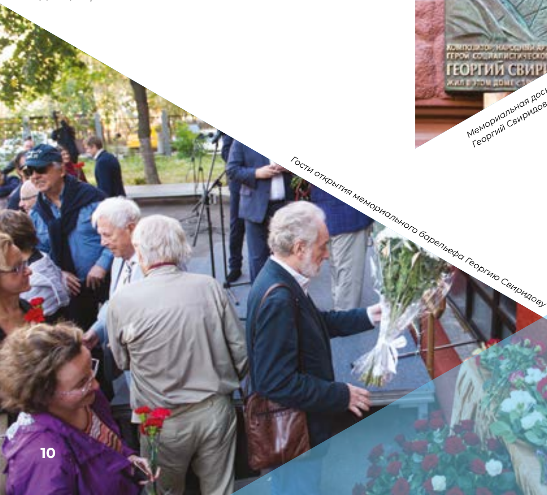
Гости открытия мемориального барельефа Георгию Свиридову