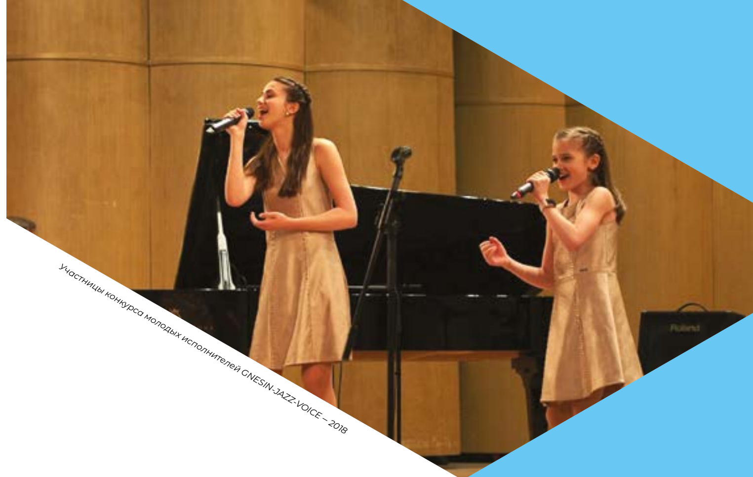
Участницы конкурса молодых исполнителей GNESIN-JAZZ-VOICE – 2018