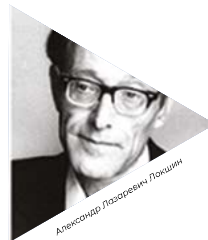
Александр Лазаревич Локшин