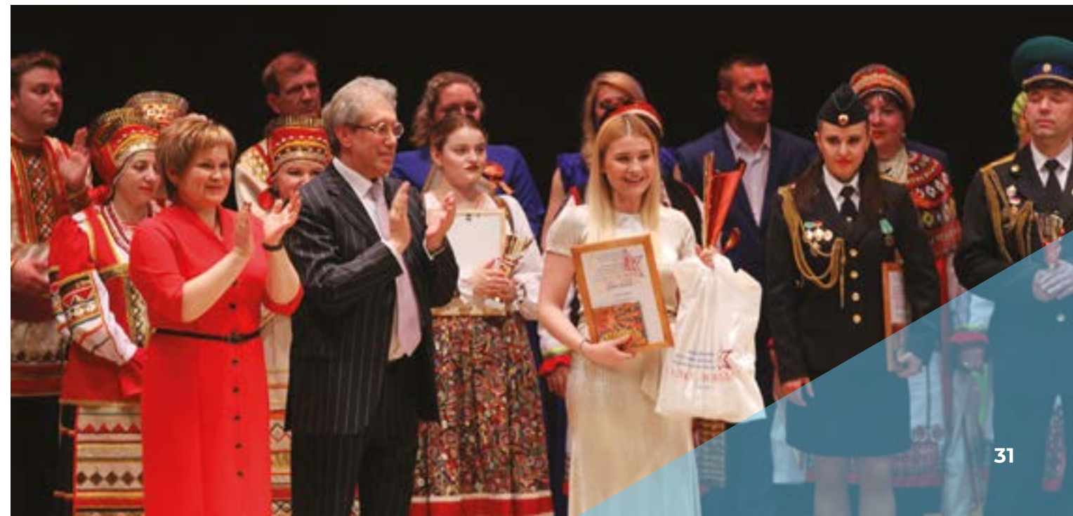
Участники фестиваля «Салют, Победа!»

Программы фестиваля-конкурса «Салют, Победа!» посмотрели более 3000 человек – жители Рязани и гости города.