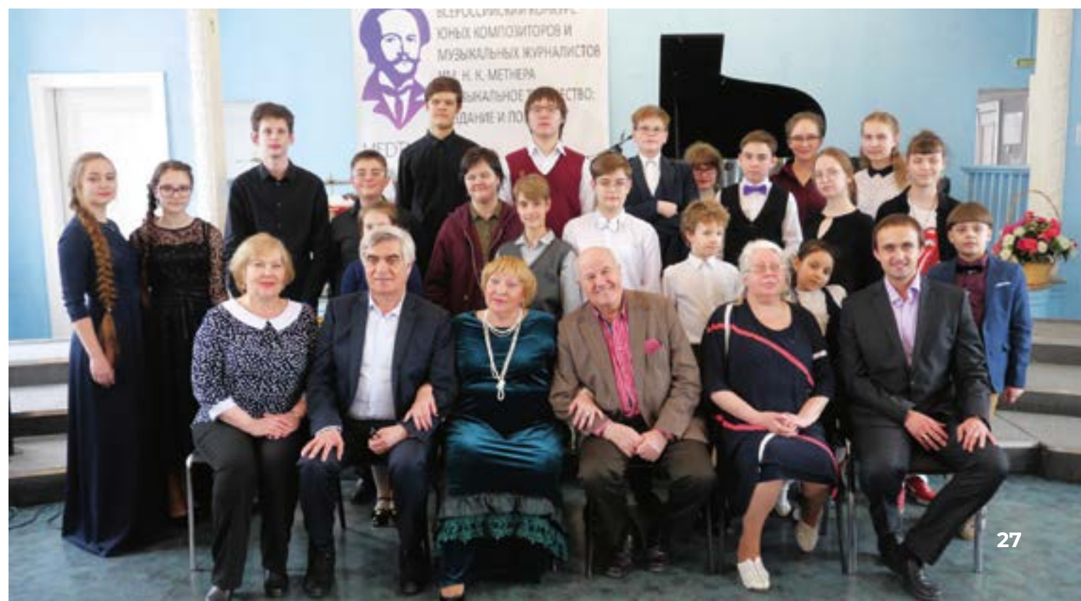
Организаторы и участники конкурса «Музыкальное творчество: создание и познание»