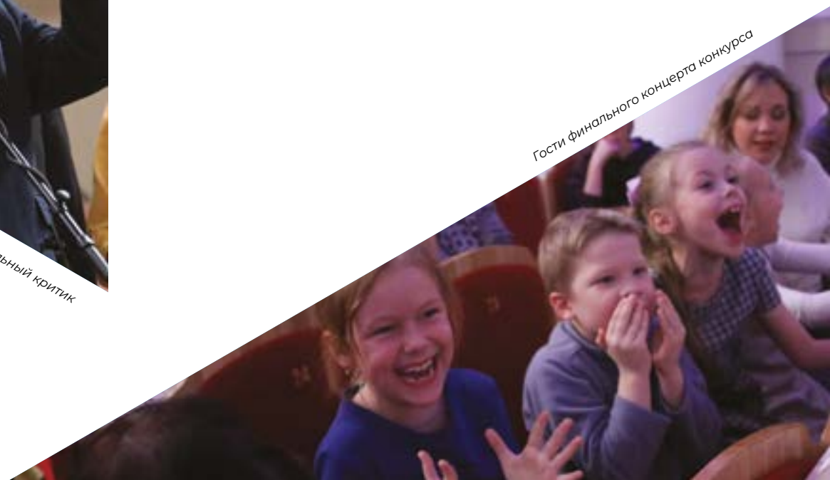
Гости финального концерта конкурса