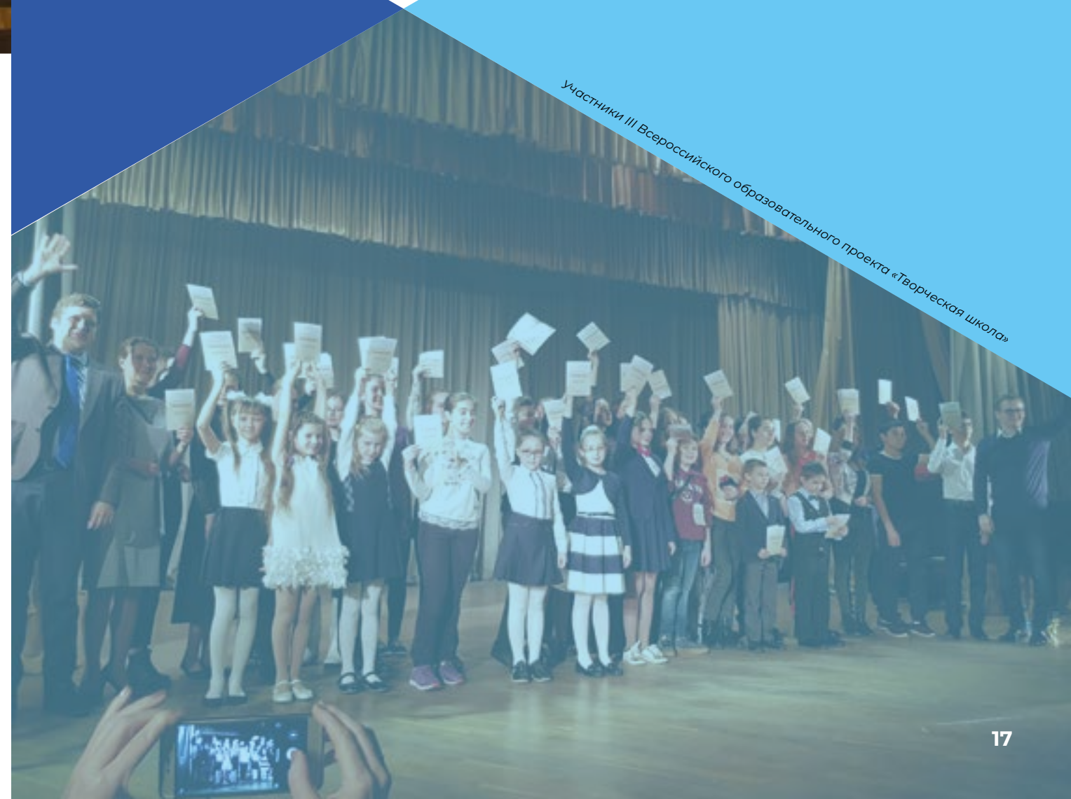
Участники III Всероссийского образовательного проекта «Творческая школа»

III Всероссийский образовательный проект «Творческая школа» в Челябинске