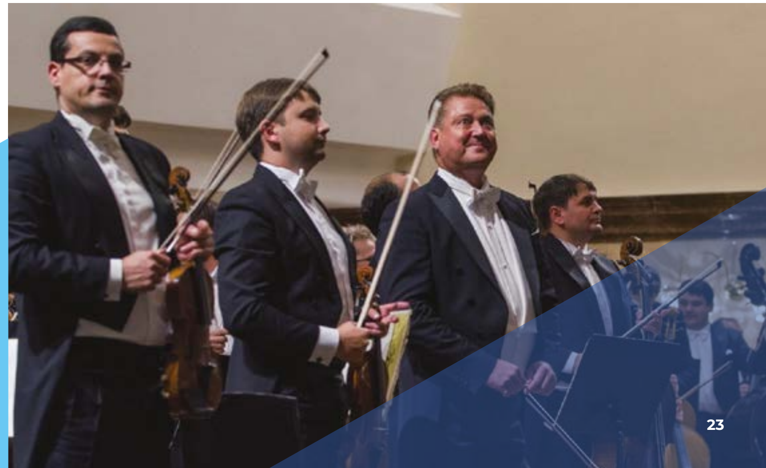
Главный дирижер симфонического оркестра Татарстана Александр Сладковский и музыканты оркестра