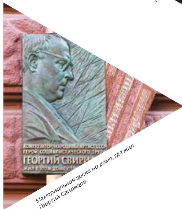
Мемориальная доска на доме, где жил Георгий Свиридов