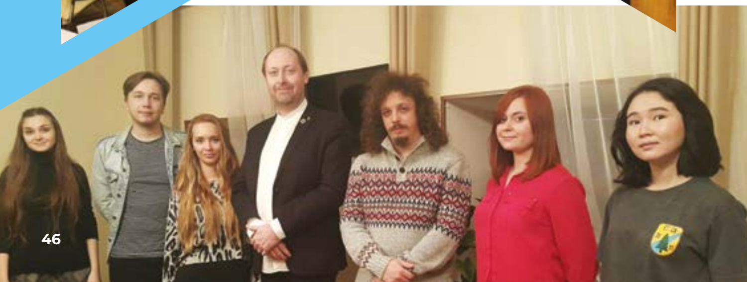
Участники творческой встречи, организованной МАМКИМ «МеждународМолОт» РМС