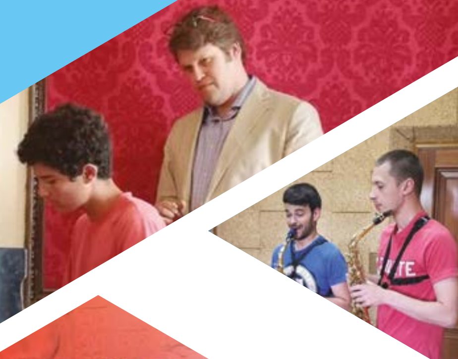
Пресс-конференция для испанских СМИ