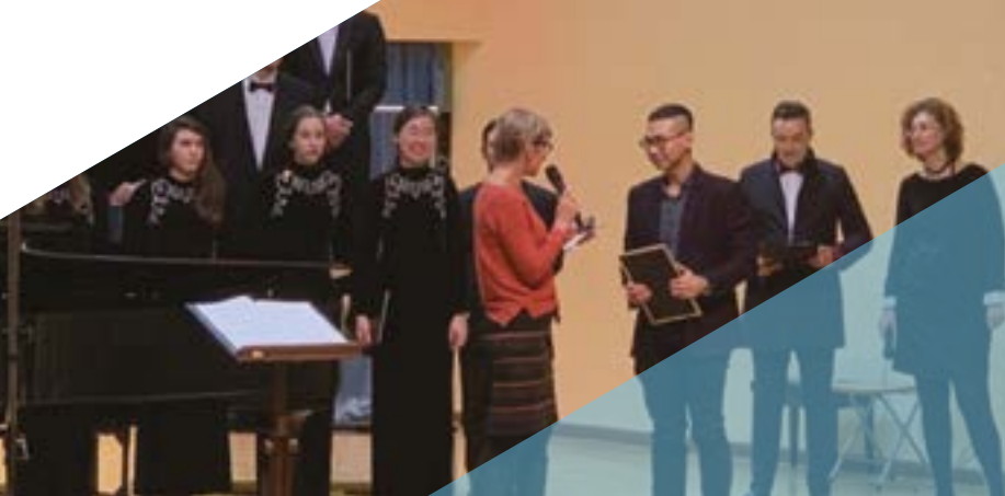
Награждение победителей конкурса

участие Хор студентов кафедры хорового дирижирования Московской консерватории и Камерный хор Московской консерватории, струнный квартет «Студии новой музыки», а также солисты – лауреаты международных конкурсов. В ходе концерта состоялась торжественная церемония награждения победителей.