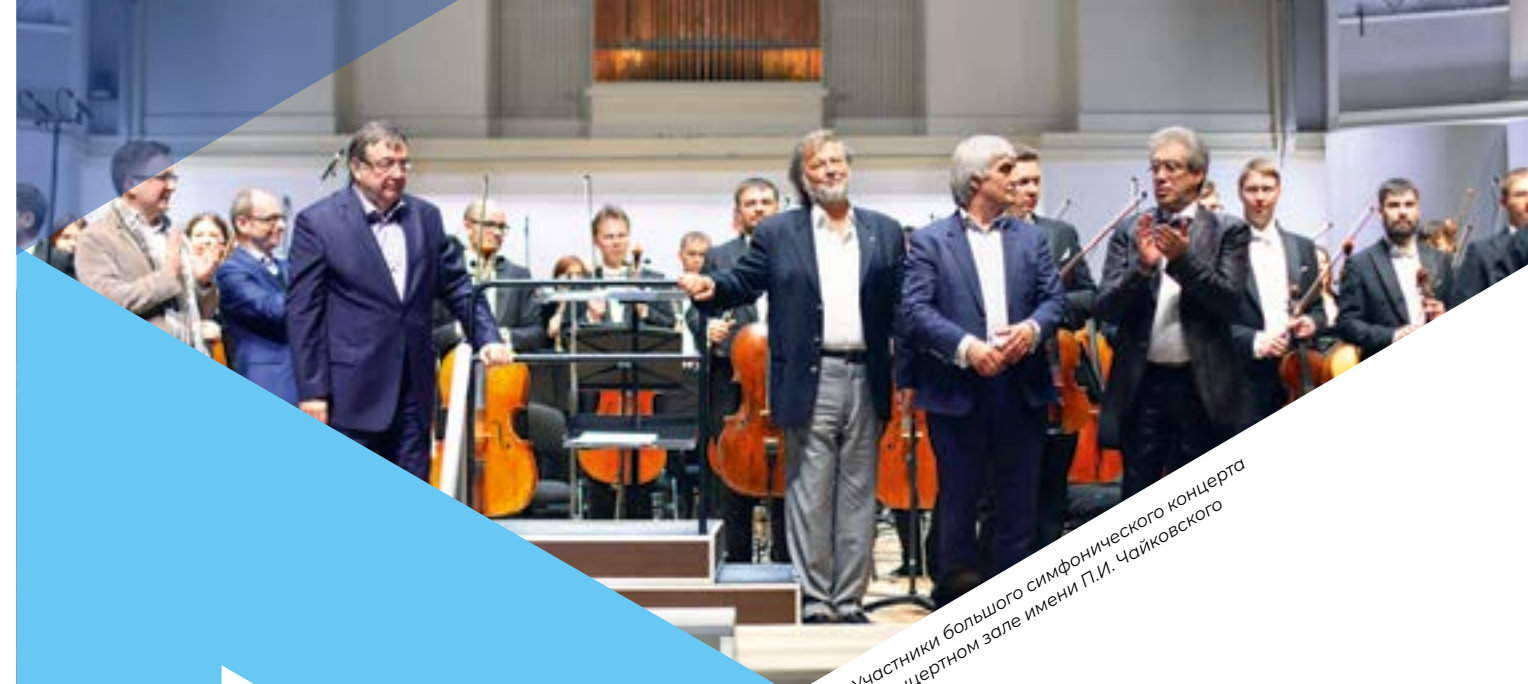
Участники большого симфонического концерта в концертном зале имени П.И. Чайковского