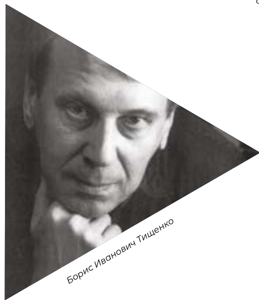
Борис Иванович Тищенко