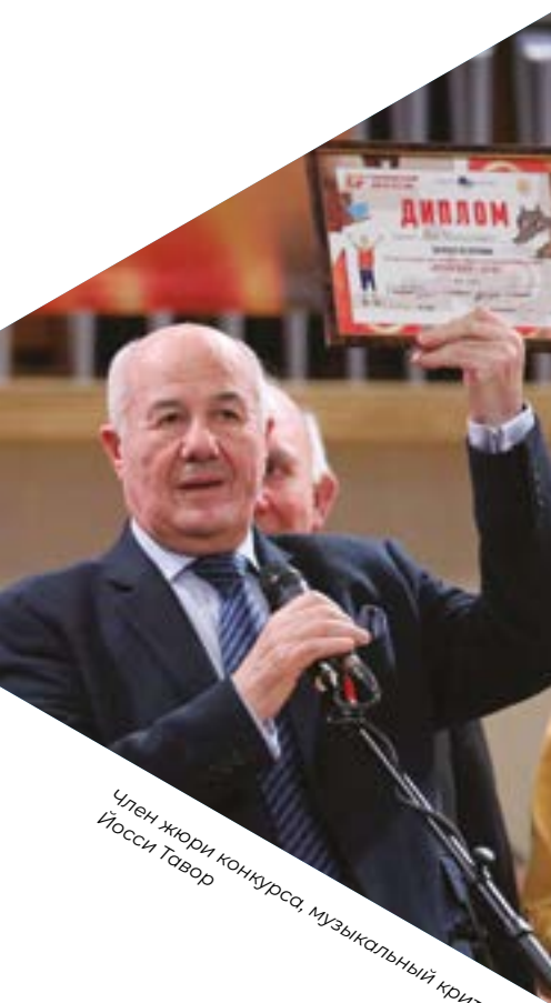
Член жюри конкурса, музыкальный критик Йосси Тавор